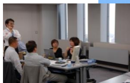
あんしんの年間3000社の参加実績

●将軍の日の由来・・・戦国時代に将軍は戦場から少し離れたところから、戦況を見ながら戦略戦術を練ったことになみ、経営者が日常業務から離れ電話も来客もない環境で経営計画を作るこのセミナーを「将軍の日」と名付けました。