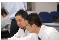
プロがマンツーマンでサポート