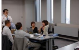
あんしんの年間3000社の参加実績