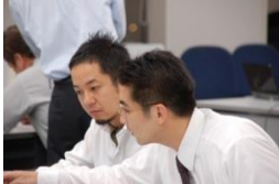
プロがマンツーマンでサポート

対象：経営者の方 場所：新都心ビジネス交流プラザ 5F 会議室3 住所：埼玉県さいたま市中央区上落合 2-3-2 日時： 月 日( ) 10:00~18:30 会費：54,000円 (税込)