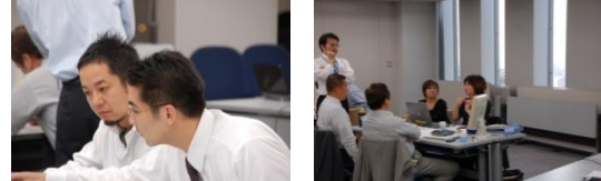
プロがマンツーマンでサポート あんしんの年間3000社の参加実績

対象：経営者の方 場所：新都心ビジネス交流プラザ 5F 会議室3 住所：埼玉県さいたま市中央区上落合 2-3-2 日時：10月13日(金) 10:00~18:30 会費：54,000円(税込)